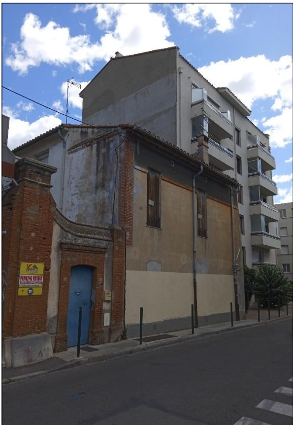
Façade rue Frédéric