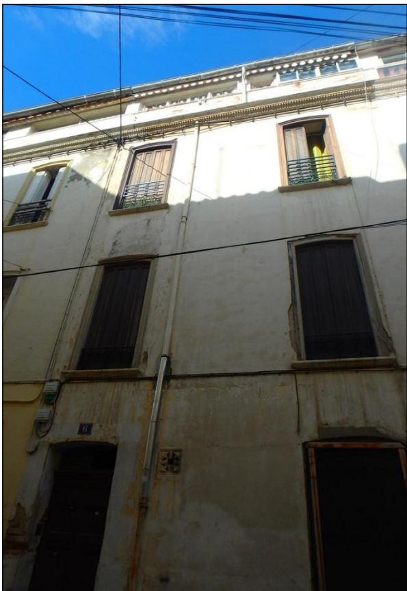
Façade rue de l'Avenir