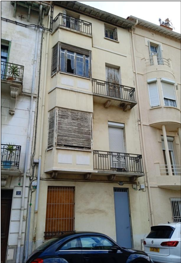
Façade (rue Cabrit)