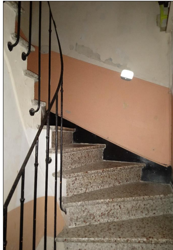
Parties communes (RDC)