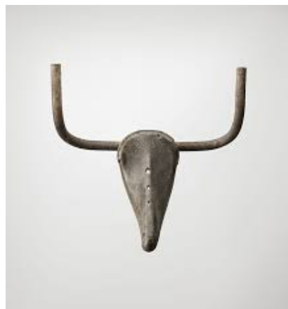
Tête de taureau, Picasso 1942

Possibilité de prendre un objet du quotidien (récupération) et le transformer en une sculpture de créature ou d'animal.