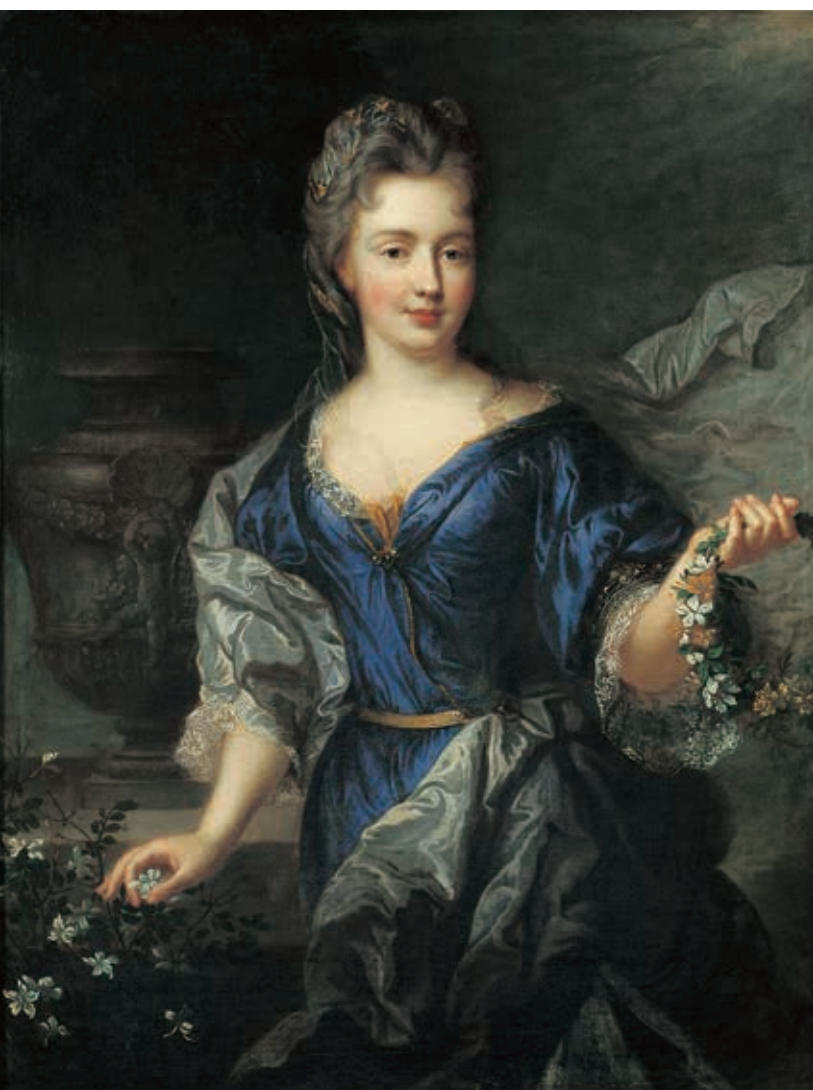
François de Troy (1645-1730), Portrait de Marie-Anne de Bourbon, princesse de Conti, vers 1690-1691. Toulouse, musée des Augustins.

Dans cette évolution générale du portrait français sous le règne de Louis XIV, un peintre allait jouer un rôle fondamental. Il s'agit de François de Troy (1645-1730), par qui le genre s'ouvrit à l'influence des écoles du nord. Son pinceau allait être en effet le vecteur d'une syntaxe picturale entièrement nouvelle mêlant, en des compositions dynamiques, un coloris chaud et harmonieux servi par une touche vibrante. Loin de l'onctuosité d'un Philippe de Champaigne – et bien que celui-ci eût été d'origine bruxelloise –, de Troy jeta un regard soutenu en direction d'Antoon van Dyck (1599-1641), digne élève de Petrus Paulus Rubens et père du portrait baroque. Il introduisit en France – après un hypothétique séjour dans les Flandres, voire aux Pays-Bas – le goût d'un clair-obscur tournant qui, parfois, semble même révéler une certaine connaissance de l'œuvre de Rembrandt. Champaigne et Robert Nanteuil viennent à peine de mourir lorsque de Troy peint le Portrait