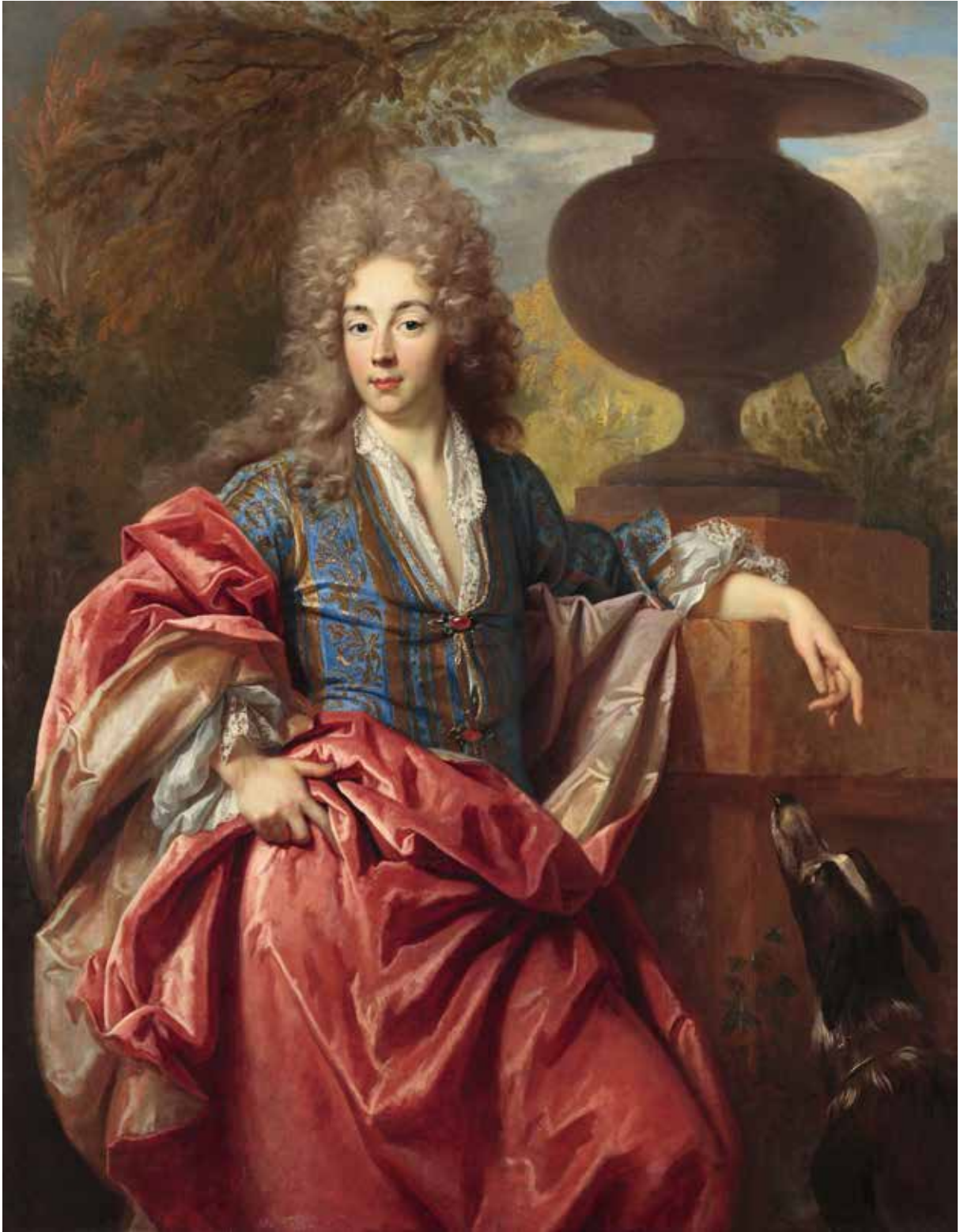
Nicolas de Largillière (1656-1746). Portrait de Gentilhomme anglais, vers 1685. Collection particulière.