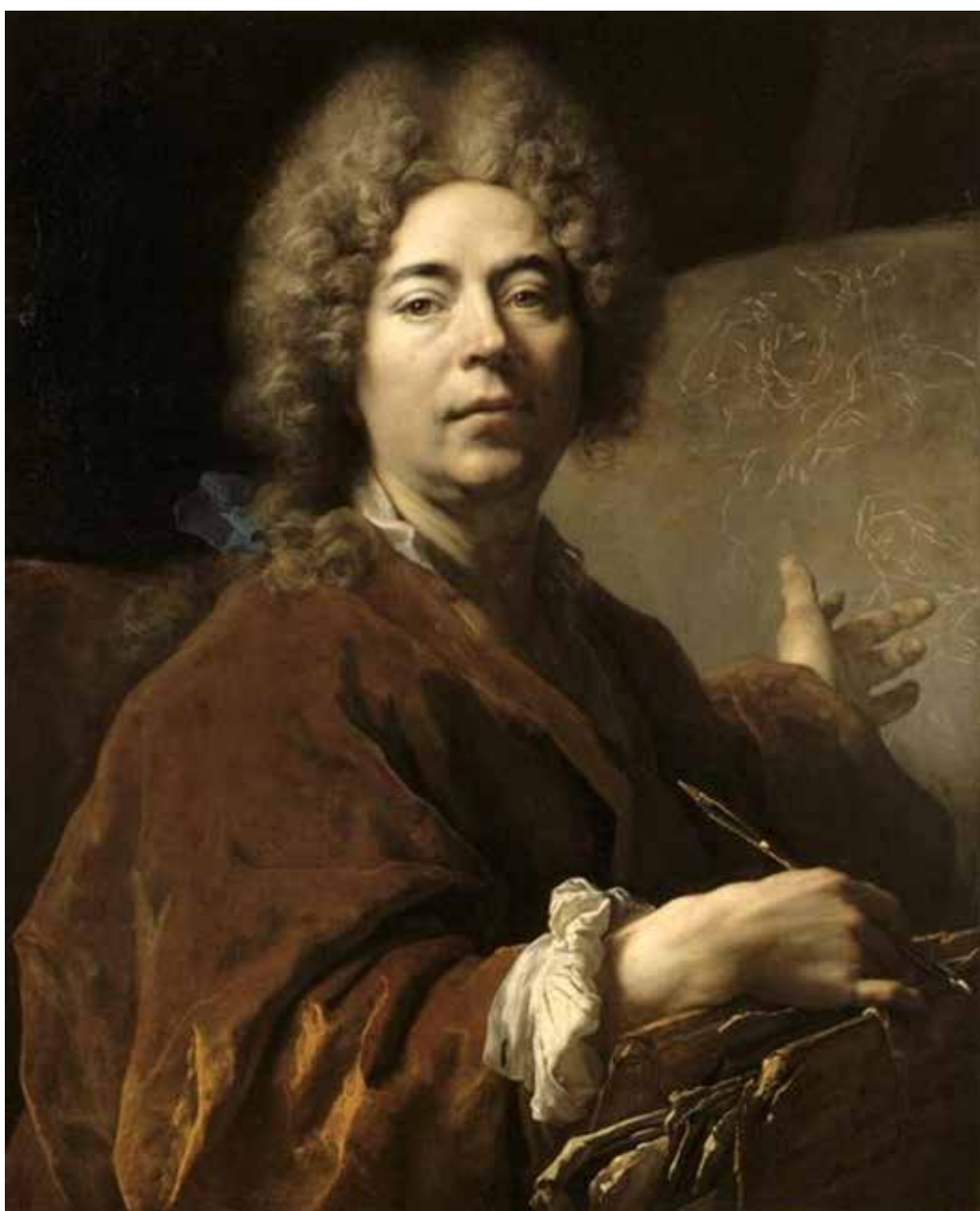
Nicolas de Largillierre (1656-1746). Autoportrait, 1711. Versailles, musée national des châteaux de Versailles et de Trianon.