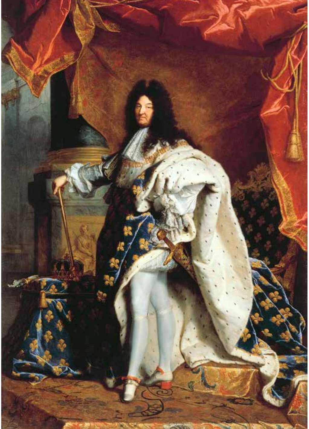
Atelier de Hyacinthe Rigaud, (1659-1743). Réplique du Portrait du portrait de Louis XIV en grand costume royal, 1701-1702. Versailles, musée national des châteaux de Versailles et de Trianon.

À l'intérieur de chaque îlot, on se plaira à souligner tant la singularité de la manière de chacun de nos peintres, que les éléments de vocabulaire (format, veine, modèle, travestissement, composition, typologie,...) relevant d'une inspiration commune. Le rapprochement de leurs œuvres, peintes ou dessinées, avec d'autres pièces contemporaines de toute nature, et notamment d'arts décoratifs, mettra en exergue le fait que le portrait, tel que de Troy, Rigaud et Largillière le conçurent, se voulait une création d'art total, réunissant en son sein tous les genres et jouant à l'envi avec ses entours (fonction, mobilier, gamme colorée et textiles du salon où il est appendu, visiteurs et proches avec lesquels le modèle peint interagit...).