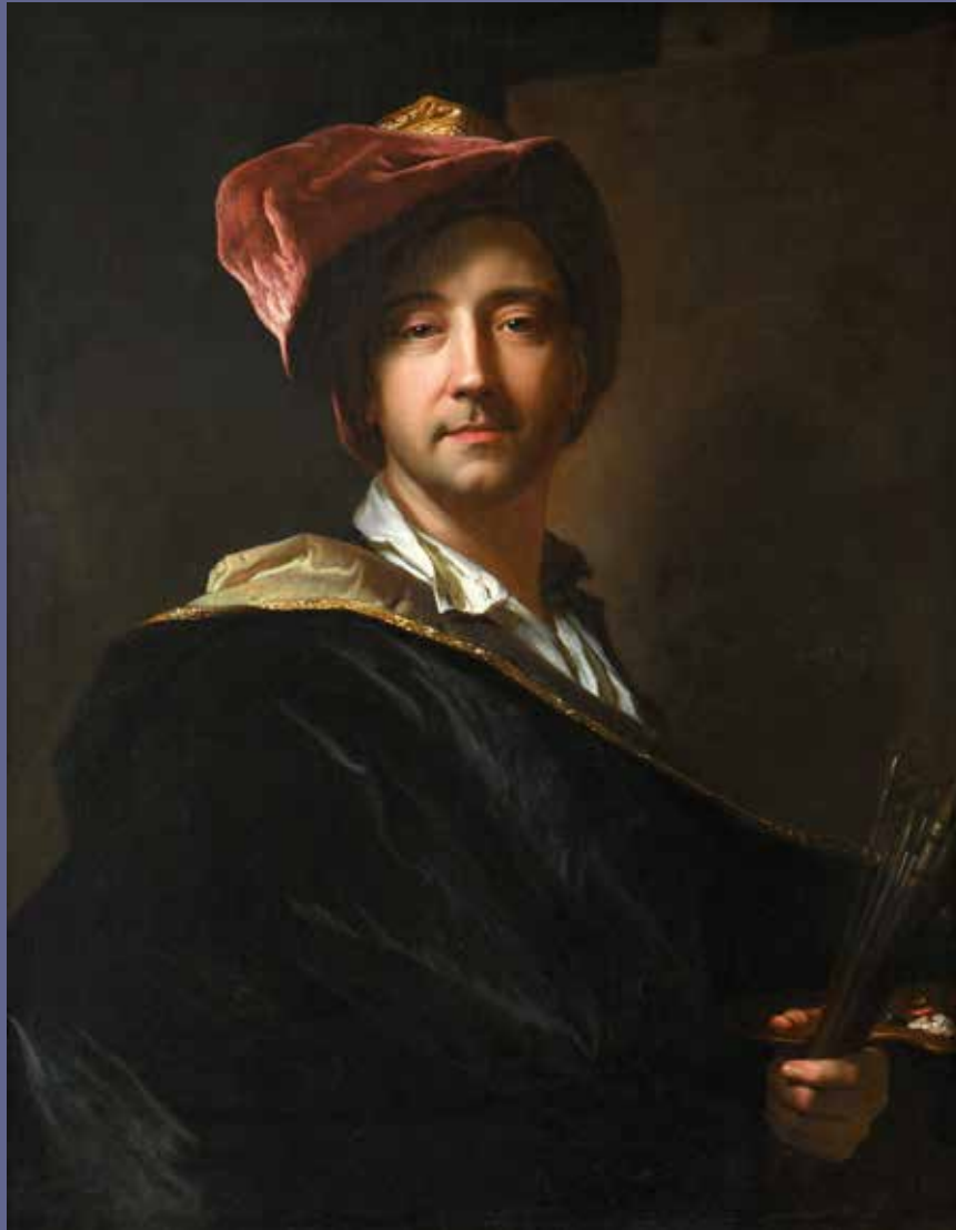
Hyacinthe Rigaud, (1659-1743). Autoportrait dit du turban, 1698. Perpignan, musée d'art Hyacinthe Rigaud.