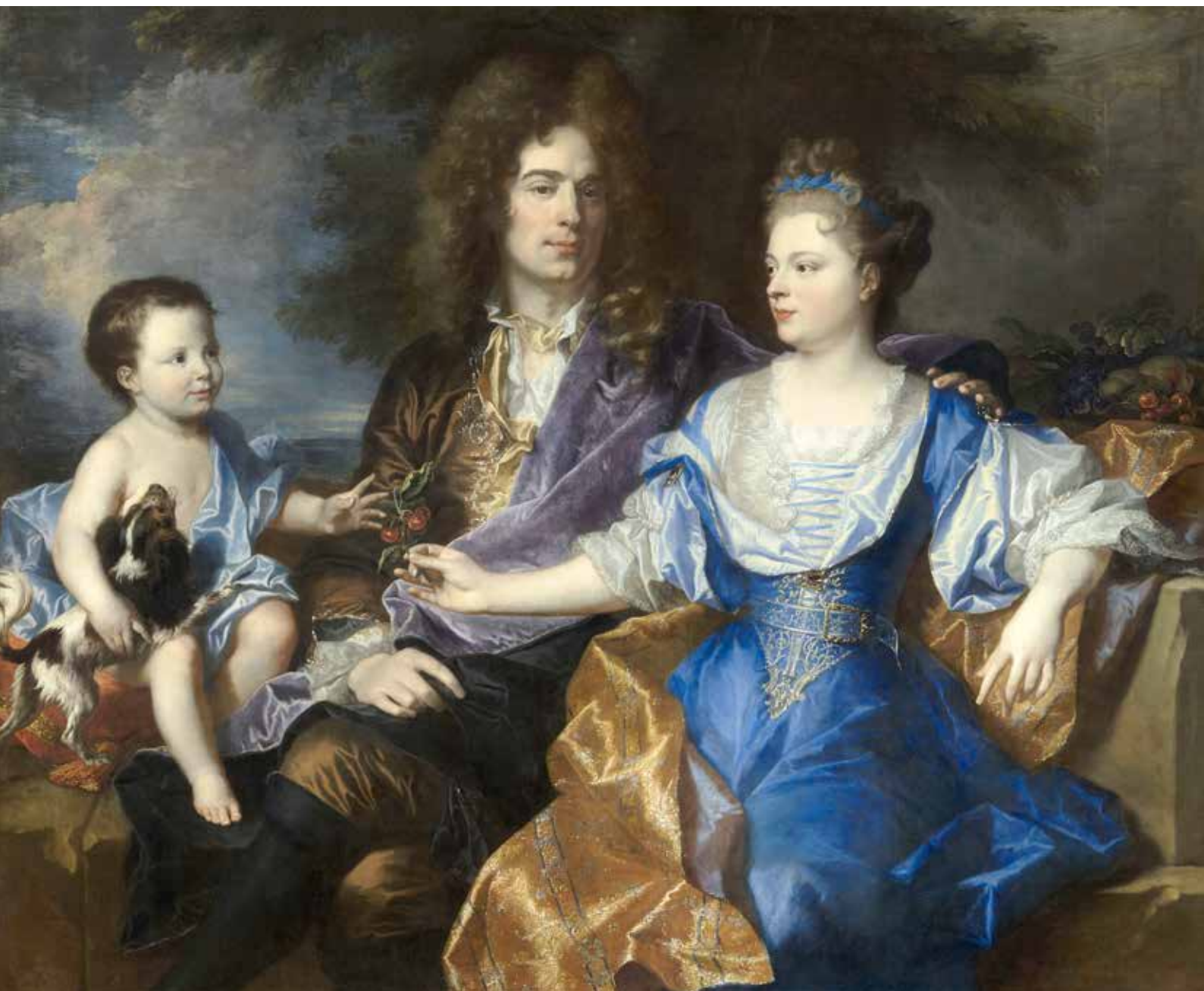
Hyacinthe Rigaud, (1659-1743). Portrait de la famille Léonard, 1692-1693. Paris, musée du Louvre.