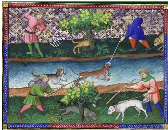
Il·lustració treta del Livre de chasse de Gaston Phébus, Ci devise comment on doit chasser et prendre la loutre , inici del segle XV, París, Biblioteca nacional de França, Departament dels Manuscrits, Francès 616 folio 101v

La llúdriga s'alimenta bàsicament d'espècies aquàtiques i semi-aquàtiques, essencialment peixos així com també crancs de riu, mol·luscs, petits mamífers, amfibis invertebrats aquàtics i terrestres. S'adapta als recursos disponibles.