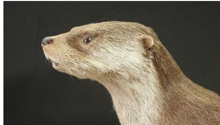
Dissecció de la llúdria trobada morta a Ceret el 07.10.2004; nariu, ull i orella són alineats en un mateix pla. Col·l. Museu d'Història natural.

És una carnívora amfíbia: utilitza el medi aquàtic per a nodrir-se i, ocasionalment, per a desplaçar-se ja que hi és adaptada, gràcies al seu cos hidrodinàmic, les seves potes amb membranes interdigitals, i el seu pèl molt dens que limita les pèrdues de calor.