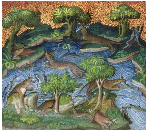
Il·lustració treta del Livre de chasse de Gaston Phébus, Ci devise De la loutre et de toute sa nature , França, inici del segle XV París, Biblioteca nacional de França, Departament dels Manuscrits, Francès 616, fol. 37

La llúdria és un mamífer individualista i territorial que marca el seu territori amb un dipòsit d'excrements.