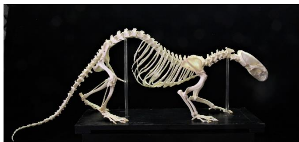
Esquelet de la llúdria trobada morta a Ceret (66), el 07.10.2004

Sembla ser que uns individus d'aquesta població hagin colonitzat des de fa poc el Vallespir (Catalunya Nord). Extraccions efectuades, el 2005, sobre l'espècimen del Museu d'Història natural de Perpinyà - trobat mort a Ceret el 2004 - confirma un vincle genètic amb la població de Catalunya Sud.