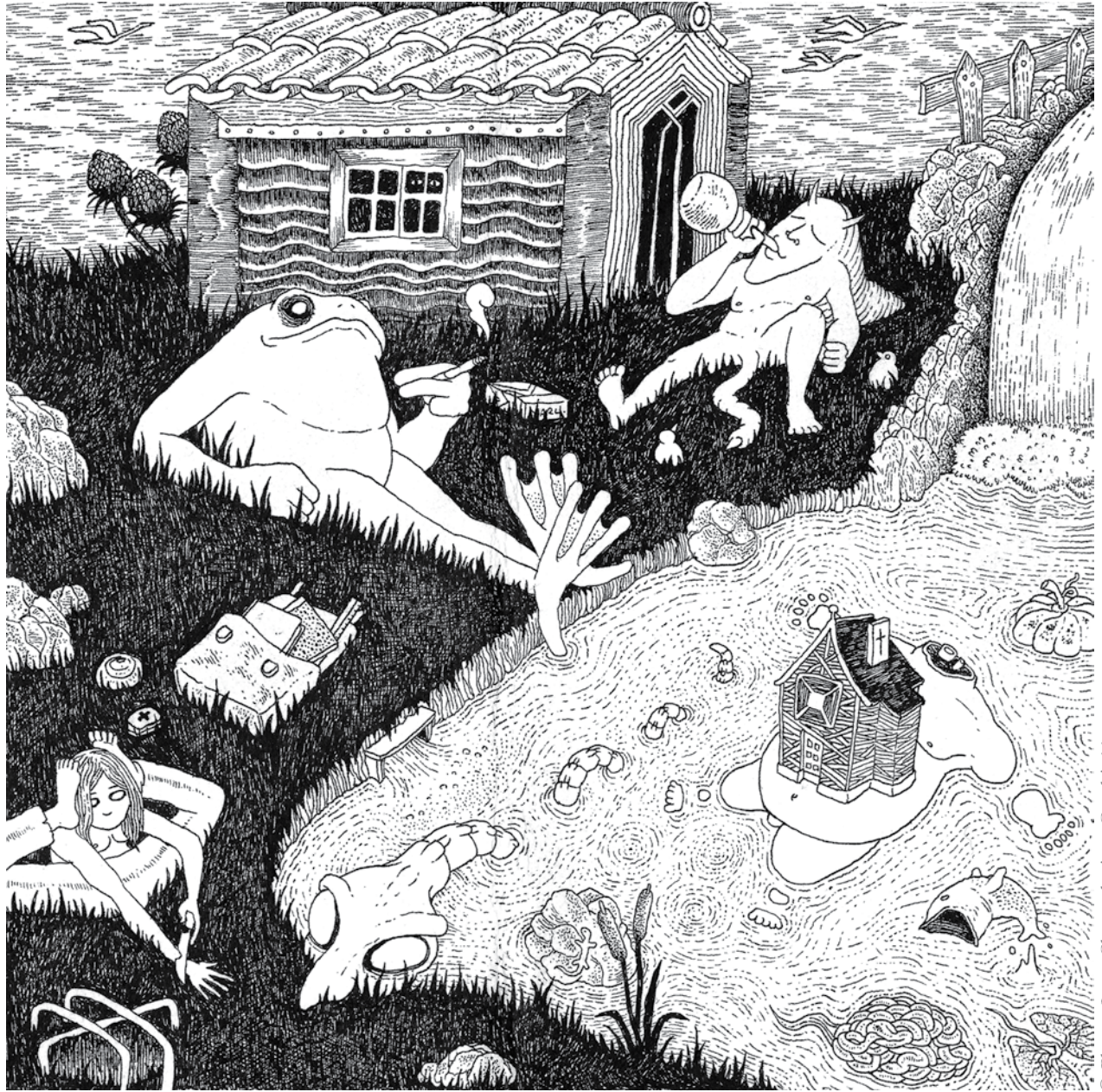
Les bucoliques , encre de chine sur papier, 21 x 15 cm.