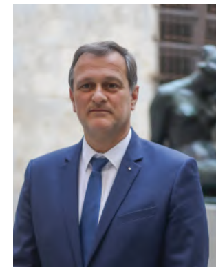
Louis Aliot, maire de Perpignan

Festival d'espoir, festival de lutte contre l'aridité de nos cœurs et de nos esprits, le festival de Musique Sacrée vous attend pour voyager aux sources de la musique et partager ces moments de bonheur et de joie.