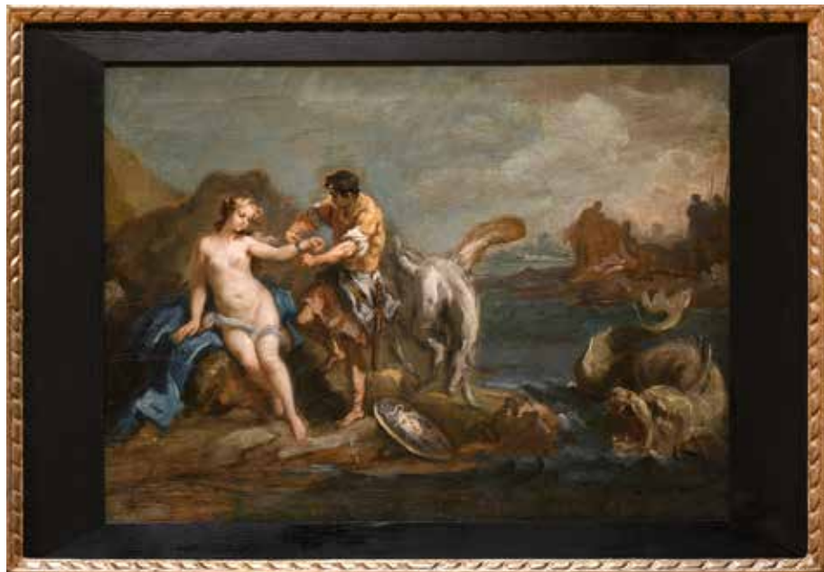
Jacopo AMIGONI (1682-1752). Persée délivrant Andromède, XVIII e siècle. Perpignan, musée d'art Hyacinthe Rigaud.