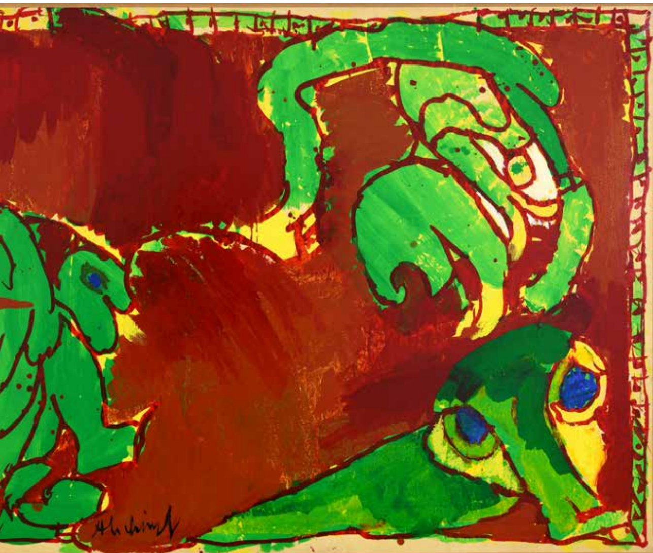
Pierre ALECHINSKY (1927-). Les ancêtres , 1976. Perpignan, musée d'art Hyacinthe Rigaud.