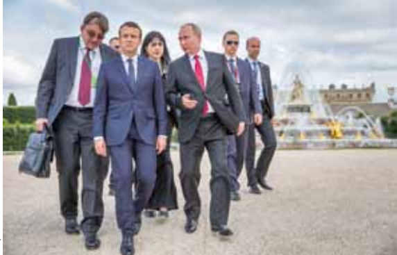
JEAN-CLAUDE COUTAUSSE Bains de foule

« Je ne raconte plus la politique comme une comédie depuis que je me suis rendu compte que j'avais devant moi des personnages de tragédie. » Pour Libération dans les années 1980 puis pour Le Monde depuis plus de quinze ans, Jean-Claude Coutausse couvre la vie politique française. Ses photos montrent les coulisses, l'euphorie des meetings comme les moments de fatigue ou de doute.