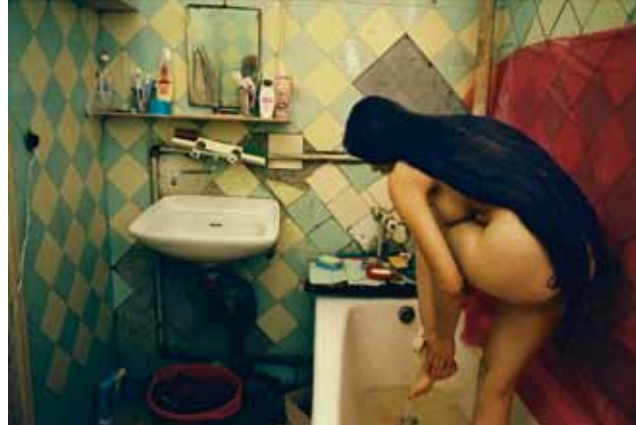
« Toute » en retrait

Que ce soit sur les traces de l'Afrique fantôme ou de la Sibérie, dans les coulisses d'un défilé de mode ou dans les derniers appartements communautaires de Saint-Petersbourg, Françoise Huguier promène sa curiosité à travers le monde depuis plus de quarante ans. Tout en discrétion, elle part à la rencontre des gens et à la recherche des traces de l'histoire.