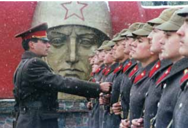
L'Ukraine, de l'indépendance à la guerre