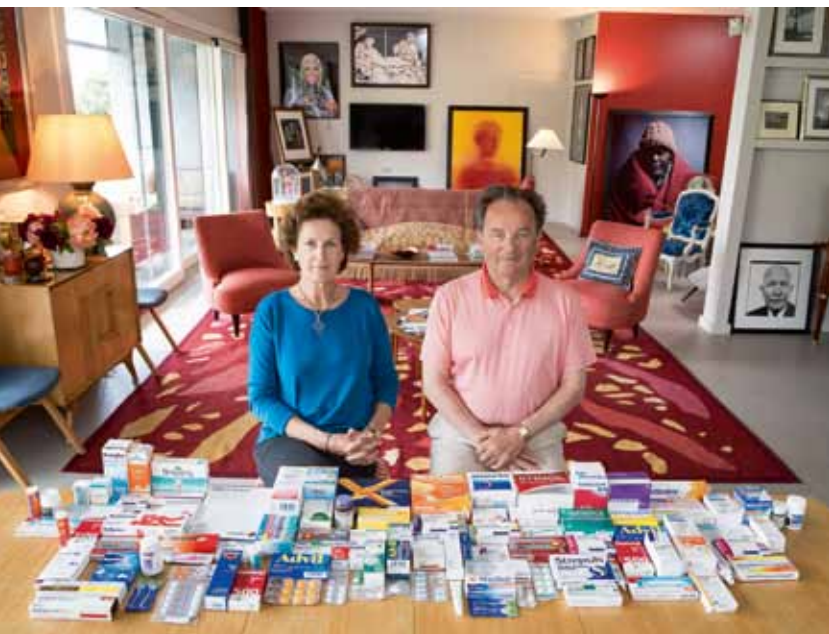
© Paolo Woods & Gabriele Galimberti