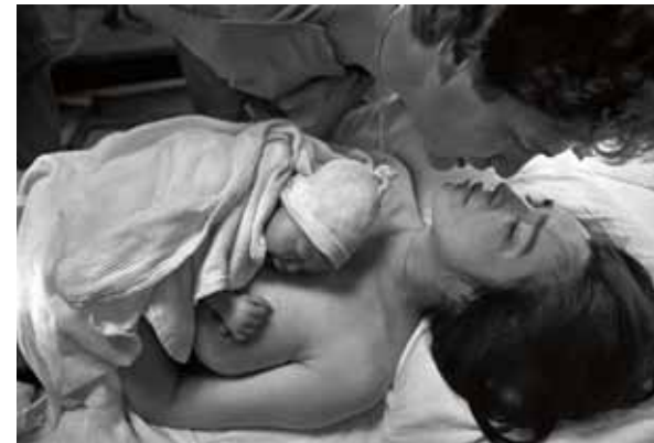
EUGENE RICHARDS En marge

Se sentant « en marge » face au nouveau visage du journalisme aux États-Unis et cherchant une nouvelle façon de travailler, Eugene Richards s'est plongé dans ses archives, parcourant cinquante années de photographie, afin de publier ses images sur Instagram. Visa pour l'Image ne pouvait pas laisser passer cette occasion de faire une exposition pour partager les souvenirs de ce très grand photographe.