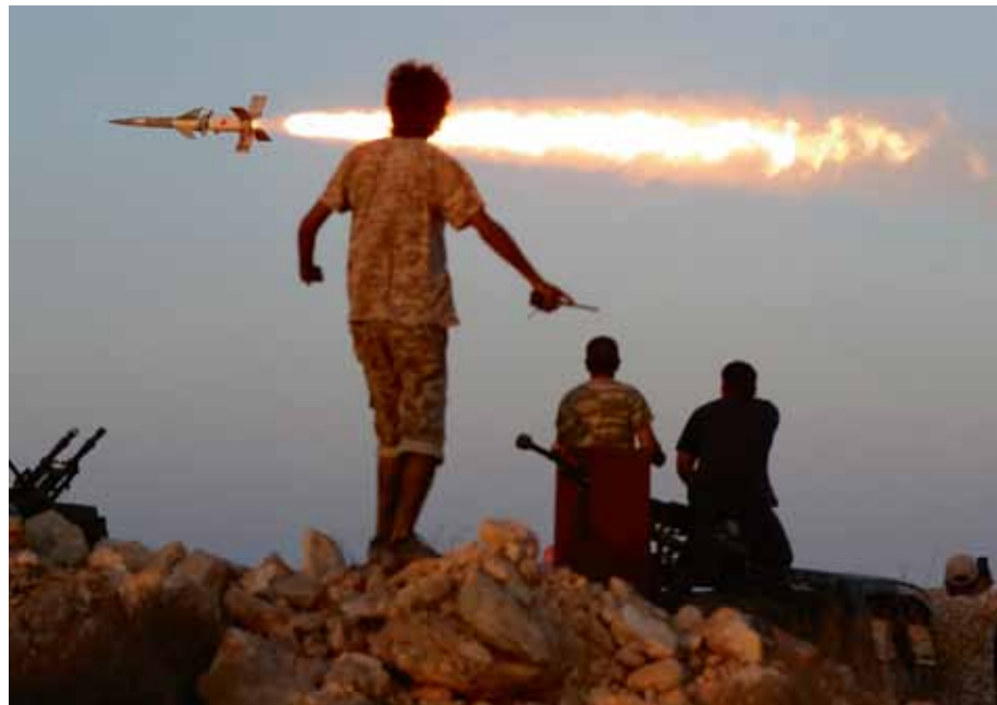
GORAN TOMASEVIC Entre guerre et paix

« J'ai eu la possibilité, et le devoir, de faire face à l'humanité dans toute sa diversité, capable du meilleur comme du pire. » Des guerres dans les Balkans à la guerre contre le terrorisme, du Printemps arabe à la répression du soulèvement en Syrie, de l'Afghanistan à l'Afrique, de l'Irak à l'Amérique latine : depuis trente ans, Goran Tomasevic s'est fait un devoir de témoigner de la réalité du monde.