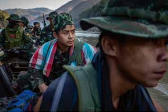
SIEGFRIED MODOLA Au cœur de la rébellion birmane

Le coup d'État militaire du 1 er février 2021 marquait la fin d'une décennie de transition démocratique en Birmanie. Depuis, les groupes rebelles et les milices citoyennes ont repris les armes et la junte mène une politique de terreur contre les zones insurgées. Dans l'État de Kayah, berceau de la résistance, des dizaines de milliers de civils ont dû fuir la violence des affrontements.